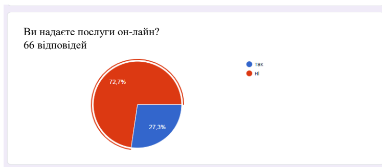
Рис 1. Питання: Ви надаєте послуги он-лайн?

Не зважаючи на те, що з початком карантину більшості органів влади рекомендували надавати всі послуги он-лайн, все ж 72,7% опитуваних зазначили, що цього не роблять.