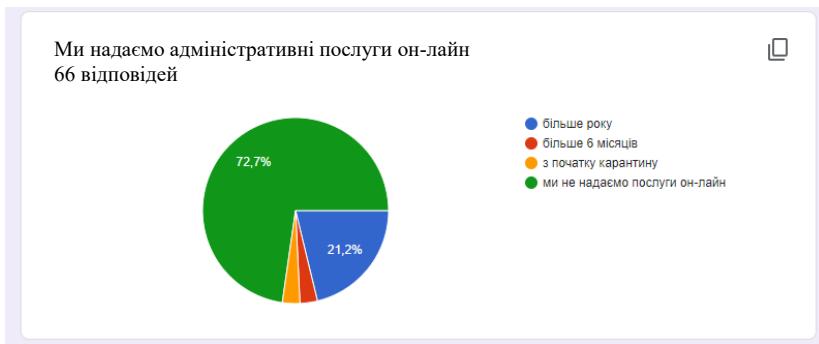
Рис 2. Питання: Як довго Ви надаєте послуги он-лайн?

Як бачимо, на первинному рівні надання адміністративних послуг карантин не спровокував різкого стрибка та масового переходу он-лайн. Більшість тих, то надає адміністративні послуги он-лайн, надав їх ще до початку карантину.